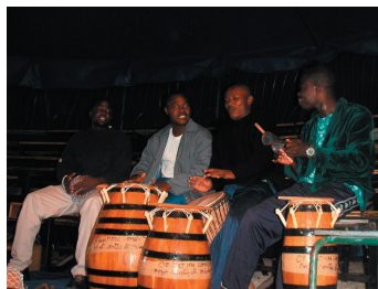
atelier théâtre à Lomé