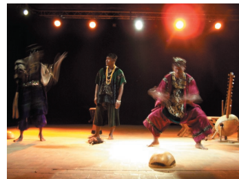
«Autour de la Kora» création 2002