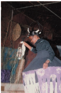
Ize Gani l'enfant vert création 2000

Depuis novembre 2004, la compagnie Aktion Théâtre a ouvert un atelier de fabrication et d'initiation aux instruments de musique traditionnelle.