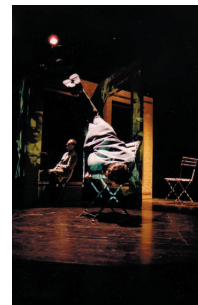
«polar» création 2002