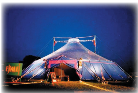
le chapiteau-théâtre Escale

Escale est conventionnée par le Ministère de la Culture, la Région Centre, le Conseil Général de l'Indre et la ville de Joué-lès-Tours