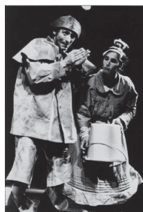
«le pêcheur et sa femme» création 1997