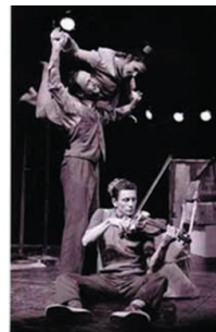
«aucun souci dans l'angle mort» création 1999